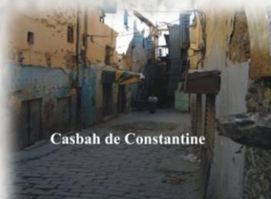
Casbah de Constantine