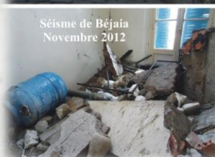
Séisme de Béjaïa Novembre 2012