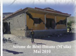
Séisme de Beni-Ilmane (M'sila) Mai 2010