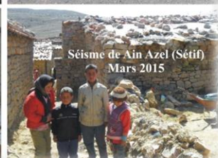
Séisme de Ain Azel (Sétif) Mars 2015